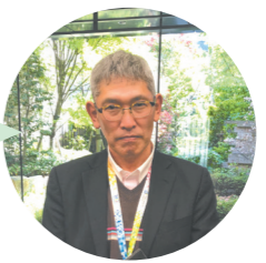
「TOKIORI浜田山」 ケアマネジャー

「TOKIORI浜田山」ケアマネジャーに聞きました！ 保険会社が作ったシニア向けトータルサポートサービス TOKIORI とは？