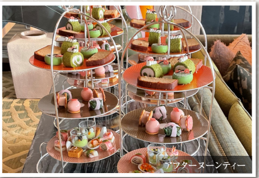
アフタヌーンティー