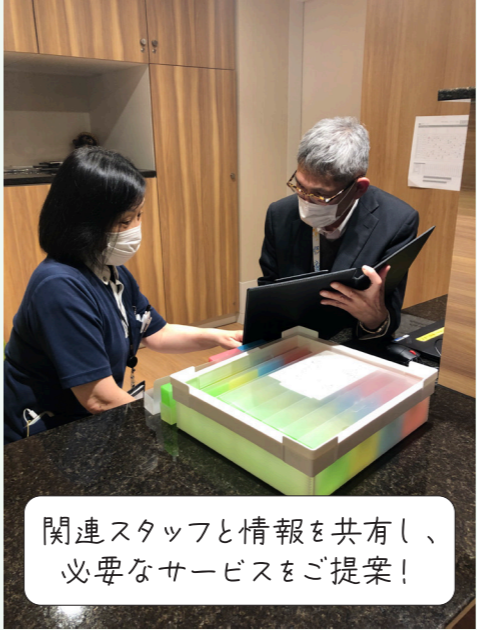
関連スタッフと情報を共有し、 必要なサービスをご提案！